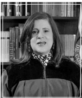
Magistrada Ponente Rocío Araújo Oñate